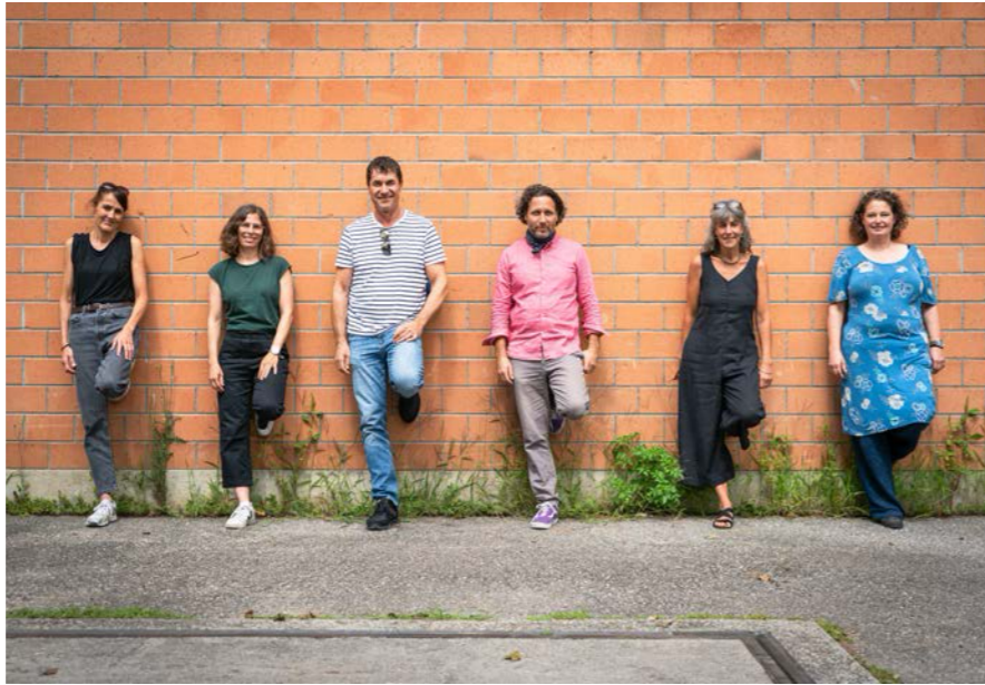
Retraite in der Sommerzeit: Der Vorstand von lernwerk bern.

Im Januar 2025 zählte der Verein rund 1490 Mitglieder. Im Verlauf des Jahres kamen rund 120 Neuzugänge hinzu, auf Jahresende gingen 73 Kündigungen ein. Der Stand im Dezember 2025 lag damit bei 1611 Mitgliedern. Für Januar 2026 rechnen wir mit rund 1520 Mitgliedern.